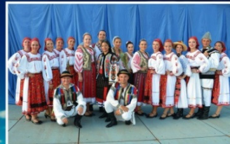
Balada - Edmonton, Alberta