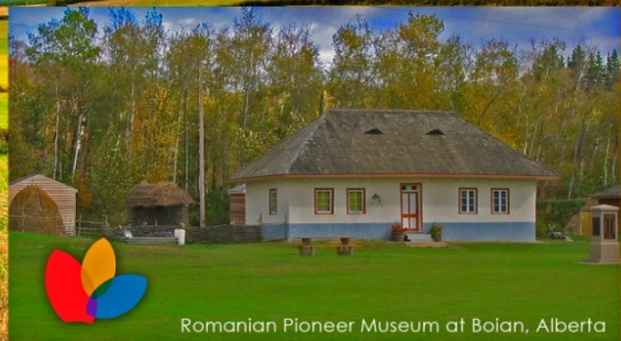
Romanian Pioneer Museum at Boian, Alberta