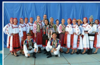
Balada - Edmonton, Alberta