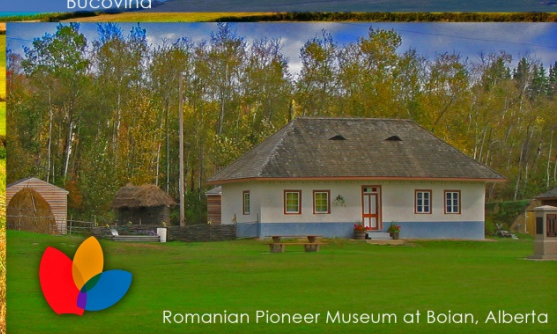
Romanian Pioneer Museum at Boian, Alberta