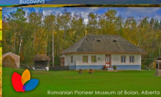
Romanian Pioneer Museum at Boian, Alberta